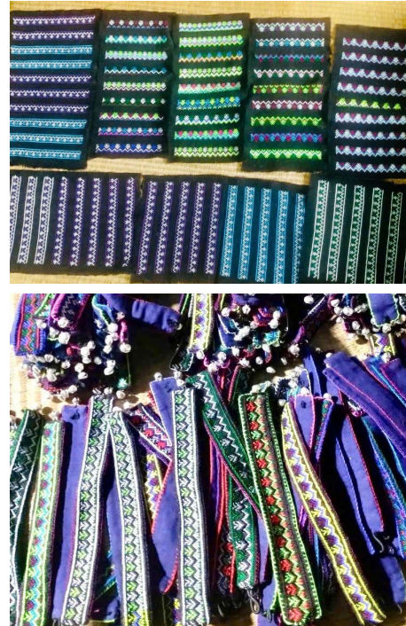
Hình 2.2. Hình ảnh các motif hoa văn được tinh giản và được đưa lên các sản phẩm du lịch nhỏ.